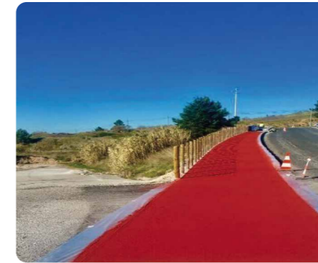
Cicloviias e Pavimentos Industriais