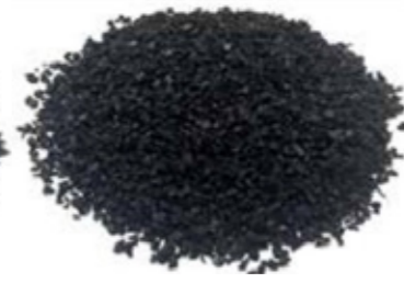
SBR de 0.5 a 2.5 mm