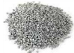
REF. ECP 1/3 BLANCO 109 RAL APROXIMADO 7047