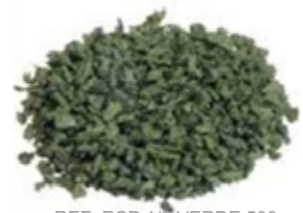
REF. ECP 1/3 VERDE 508 RAL APROXIMADO 6011