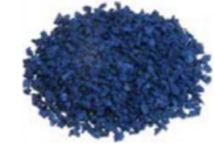
REF. ECP 1/3 AZUL 662 RAL APROXIMADO 5000