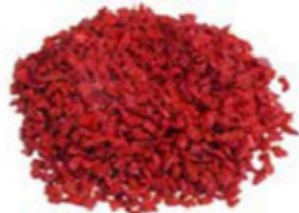
REF. ECP 1/3 ROJO 200 RAL APROXIMADO 3020