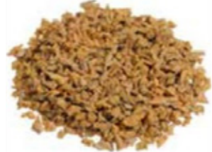
REF. ECP 1/3 MARRÓN 459 RAL APROXIMADO 1001