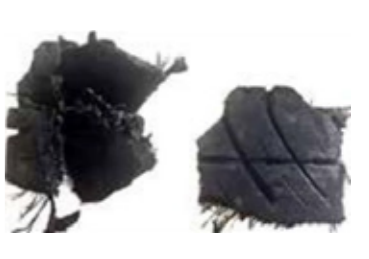
TDF small / medium / large