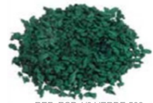
REF. ECP 1/3 VERDE 509 RAL APROXIMADO 6029