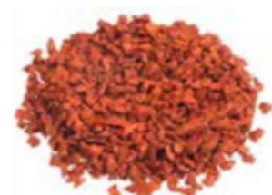
REF. ECP 1/3 NARANJA 218 RAL APROXIMADO 2009