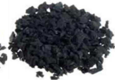
SBR de 4 a 8 mm