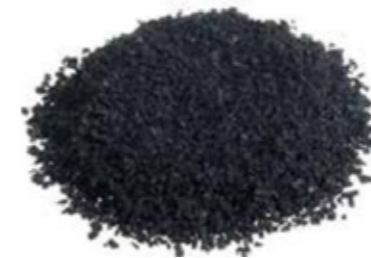
SBR de 0.5 a 2 mm