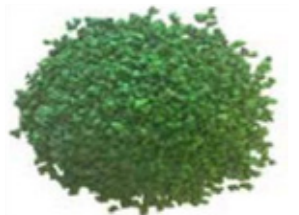
REF. ECP 1/3 VERDE 517 RAL APROXIMADO 6018