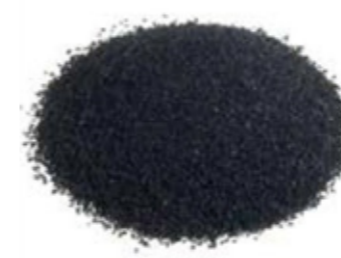
SBR menor de 0.5 mm

Granulometría | Granulometry | Granulométries