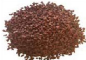
REF. ECP 1/3 ROJO 208 RAL APROXIMADO 3013