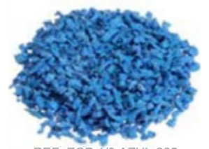
REF. ECP 1/3 AZUL 665 RAL APROXIMADO 5024