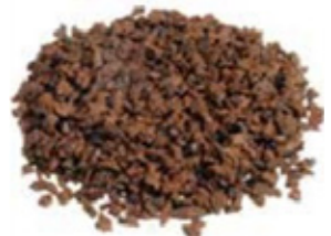
REF. ECP 1/3 MARRÓN 400 RAL APROXIMADO 8002