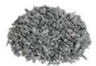
REF. ECP 1/3 GRIS 101 RAL APROXIMADO 7045