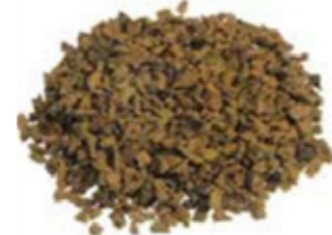
REF. ECP 1/3 AMARILLO OCRE 300 RAL APROXIMADO 8000