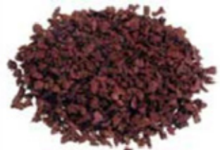
REF. ECP 1/3 ROJO 204 RAL APROXIMADO 3011