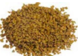
REF. ECP 1/3 AMARILLO 324 RAL APROXIMADO 1004