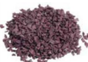
REF. ECP 1/3 MORADO 750 RAL APROXIMADO 4001