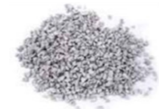
REF. ECP 1/3 BLANCO NUCLEAR 105 RAL APROXIMADO 9003