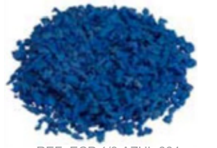
REF. ECP 1/3 AZUL 664 RAL APROXIMADO 5010