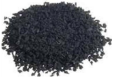
SBR de 1 a 3 mm