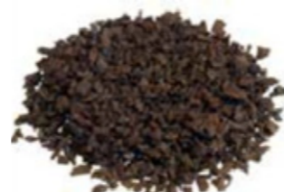
REF. ECP 1/3 MARRÓN 402 RAL APROXIMADO 8028