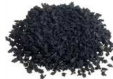
SBR de 2 a 4 mm